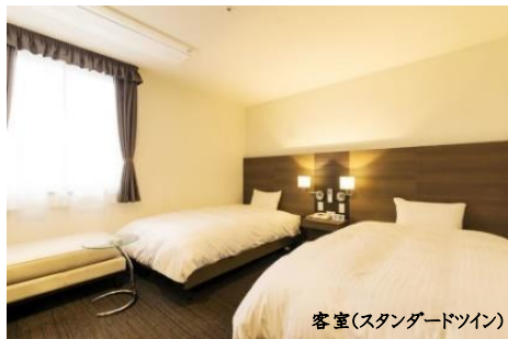
客室(スタンダードツイン)